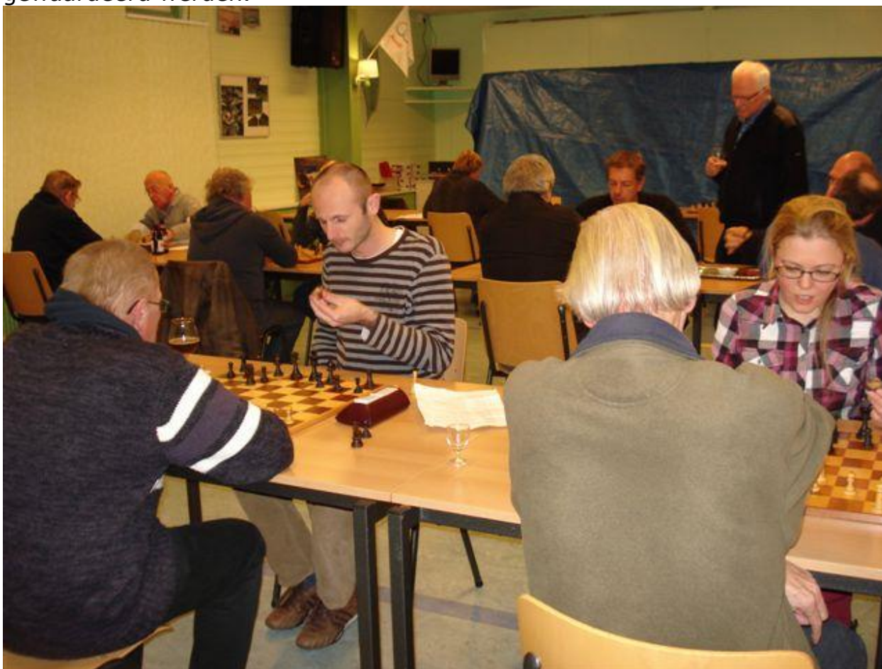
Overzicht van het jubileum toernooi 2013

Vrijdag 6 december, net na Sinterklaas, hebben we ons jubileum toernooi gehouden. Van het Witte Paard en s.c. Krommenie deden 6 deelnemers mee naast de 12 Pionners. Het werd een leuke en gezellige avond waar de alcoholische versnaperingen en overheerlijke bitterballen door menigeen zeer gewaardeerd werden.